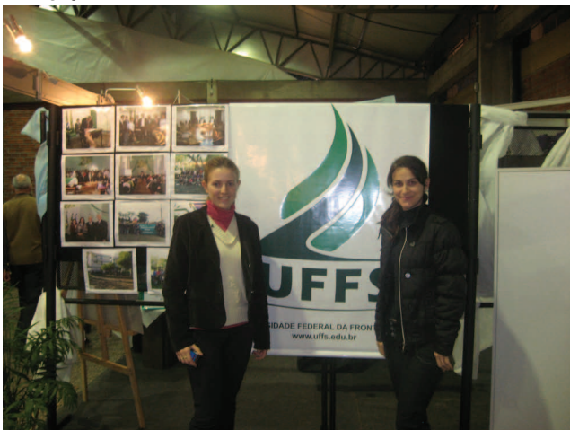
Servidoras do campus de Cerro Largo em frente ao estande montado pela UFFS, durante evento em Santa Rosa

Participação no 27º Hortigranjeiros, em Santa Rosa, divulgou os cursos da Universidade Federal da Fronteira Sul (UFFS), campus de Cerro Largo. Entre os dias 23 a 27 de setembro, uma equipe de servidores do campus esteve com estande próprio no evento. A participação teve como objetivo tornar o campus de Cerro Largo e a própria UFFS conhecida na região, expondo os cursos oferecidos e destacando a importância da chegada de uma universidade pública para a