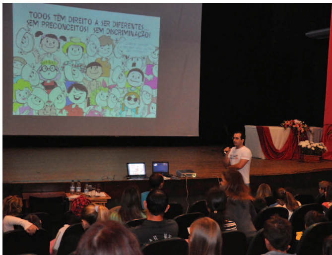
Professores da UFFS do campus Realeza interagiram com estudantes das escolas locais