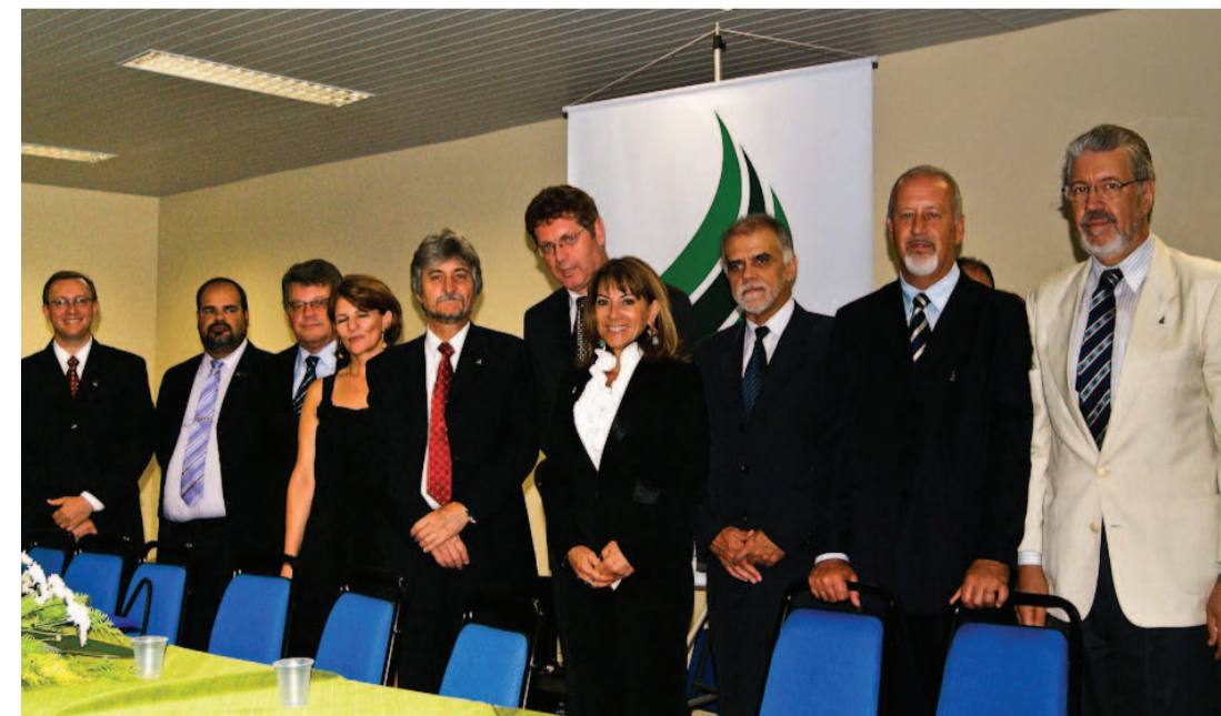
Cerimônia de apresentação da reitoria em Chapecó

O processo para a construção dos campi definitivos da UFFS em Chapecó, Cerro Largo, Erechim, Realeza e Laranjeiras do Sul também já é realidade: o processo de licitação das obras de seis prédios para salas de aula está em andamento. No campus-sede, quatro prédios para laboratórios já estão em construção. ■