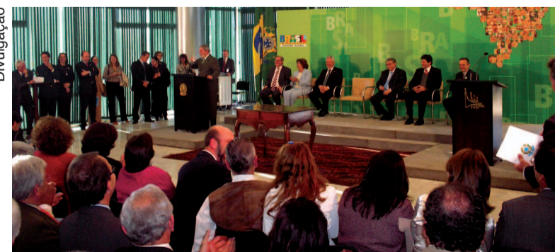
Assinatura da lei de criação da UFFS pelo presidente Lula, em 15 de setembro de 2009

Quando a Lei 12.029 foi sancionada houve comemoração por todos que ajudaram a constituir a ideia, se esforçaram na unidade de uma instituição, estudaram e repetiram todos os argumentos, investiram tempo no sonho de uma universidade federal na Mesorregião Fronteira Mercosul. Um ano depois, em 15 de setembro de 2010, o sentimento se divide entre o dever cumprido e a vontade de superar os milhares de novos desafios. A Universidade Federal da Fronteira Sul (UFFS) compartilha com toda comunidade do Sudoeste do Paraná, Oeste de Santa Catarina e Noroeste do Rio Grande do Sul as conquistas desse período. A vontade de ter uma universidade federal na região é antiga, mas em 2005 entidades, ONGs, igrejas e movimentos sociais conseguiram uma coesão para criar um Movimento Pró-Universidade Federal. Nesse ano também veio a primeira sinalização de possibilidade de implantação de uma universidade pelo governo federal. De lá até 15 de setembro de 2009, muitos foram os acontecimentos. A Universidade Federal de