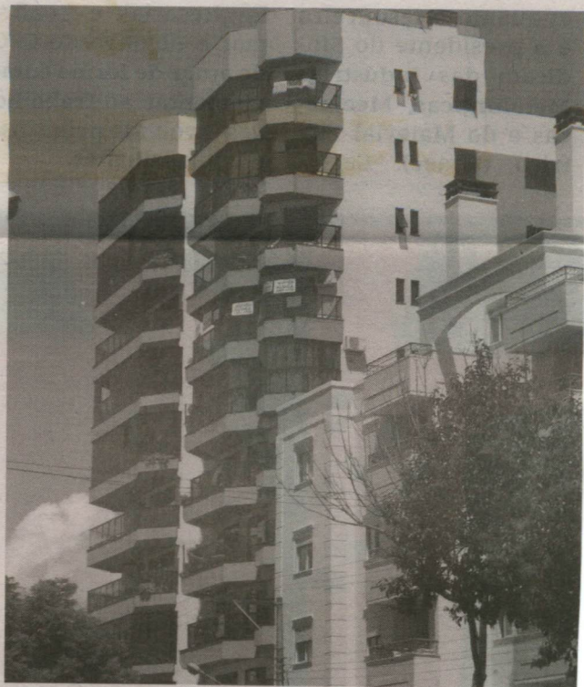
Busca dos estudantes geralmente é por apartamentos