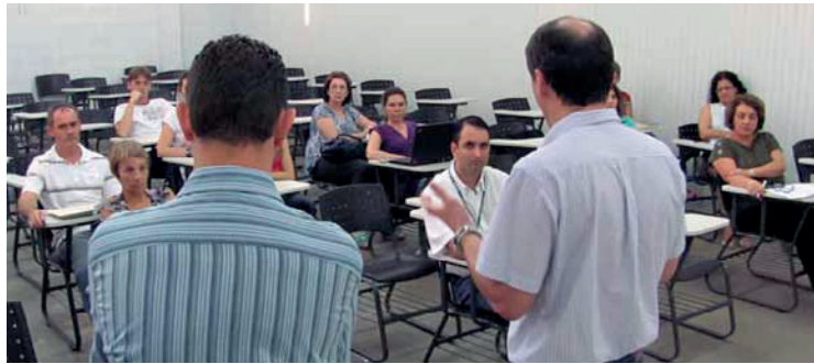
Dirigentes do campus apresentaram documento com parâmetros para estágios da UFFS