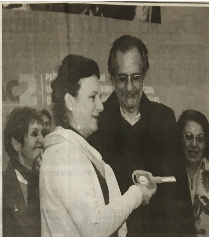
Prefeitos receberam as chaves dos caminhões do ministro Miguel Rosseto

Durante o evento, também foi apresentado o Plano Safra 2014/2015. O plano prevê um crédito de R$ 24,1 bilhões para os agricultores familiares de todo o Brasil. Desses, R$ 2,8 bilhões estarão