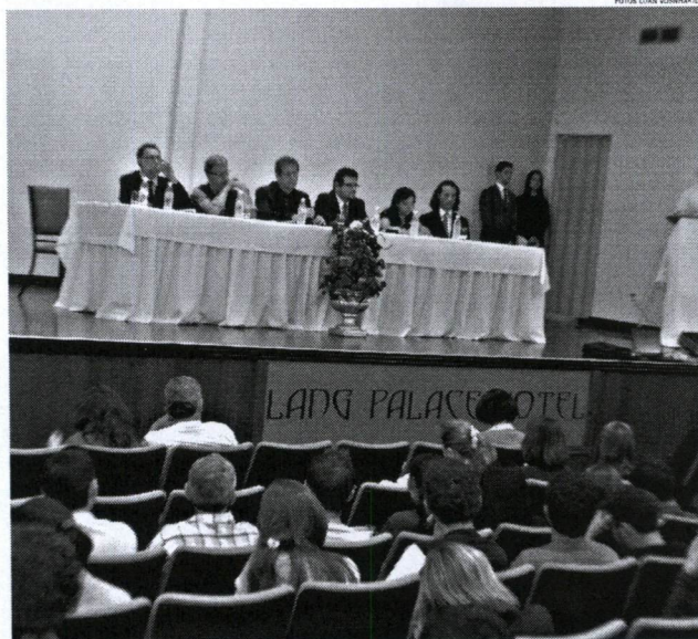
EDUCAÇÃO Projeto teve aula inaugural na tarde de ontem

Aproximar a universidade da comunidade é a aposta do projeto, que