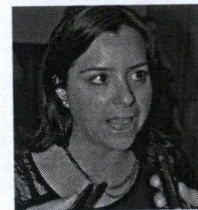
“ SEVERINE MACEDO, secretária Nacional da Juventude

Queremos permitir aos jovens um caminho do conhecimento.